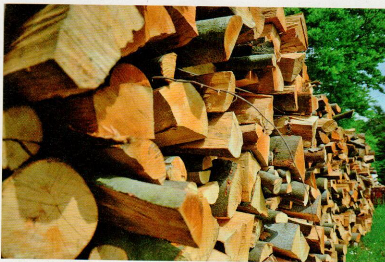
Biomasse direkt aus der Region – www.biomasse-ennstal.at bringt Anbieter und Kunden zusammen.