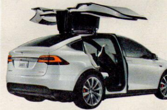
Tesla zum Testen: Beim „Tag der lautlosen Freiheit“ können auch zwei Tesla-Modelle kostenlos getestet werden.