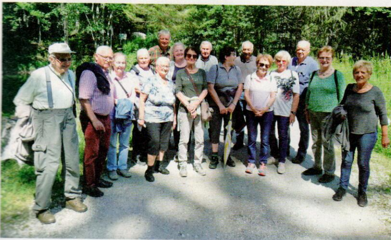
Die Wanderung führte den Seniorenbund Stainach zum Tauplitzer „Sagtümpel“.

sonders interessant. Das Wasser der Quelle führt zum Tauplitzer Wasserfall, dessen 30 Meter hohe Kaskade in den Grimmbach stürzt. Der Rückweg führte nach einer Genussjause im „Troadkastl“ wieder zurück nach Stainach. Bereits zwei Wochen später trafen sich die Stainacher Senioren zu einem gemütlichen Beisammensein im Schlossteich-Stüberl am Fuße des Schlosses Trautenfels.